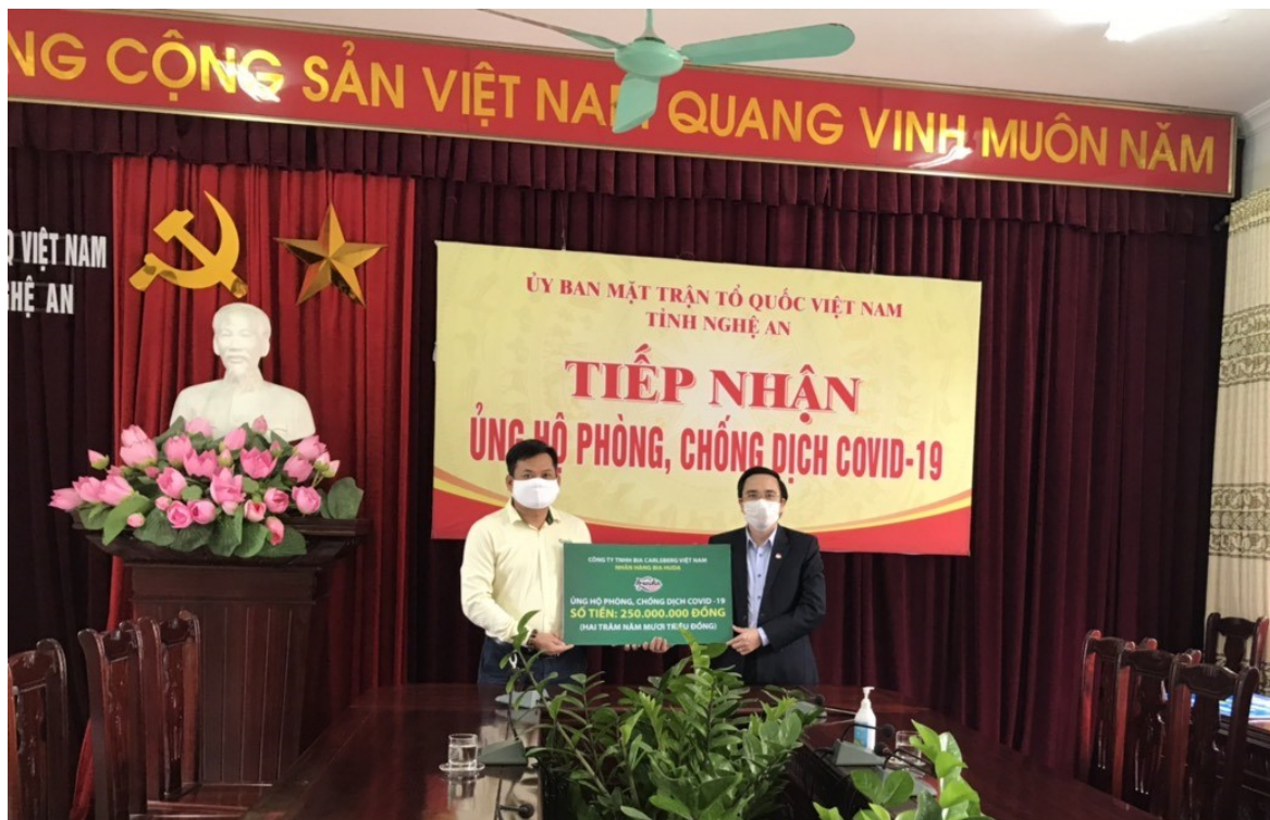
Carlsberg Việt Nam trao tặng tiền ủng hộ phòng, chống COVID-19 cho tỉnh Nghệ An