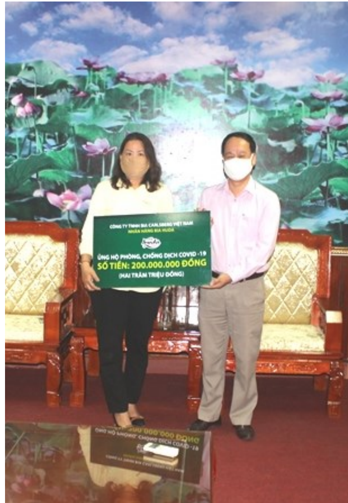
Carlsberg Việt Nam trao tặng tiền ủng hộ phòng, chống COVID-19 cho tỉnh Quảng Trị