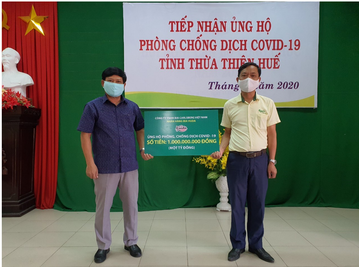
Carlsberg Việt Nam trao tặng tiền ủng hộ phòng, chống COVID-19 cho tỉnh Thừa Thiên Huế

bia Huda đã đóng góp 2 tỉ đồng nhằm hỗ trợ lực lượng tuyến đầu chống dịch COVID-19 tại 5 tỉnh miền Trung gồm Thừa Thiên Huế, Quảng Trị, Quảng Bình, Hà Tĩnh và Nghệ An. Số tiền này sẽ được dùng vào việc cung cấp các thiết bị và vật tư y tế cần thiết như khẩu trang, dung dịch sát khuẩn và trang phục bảo hộ.