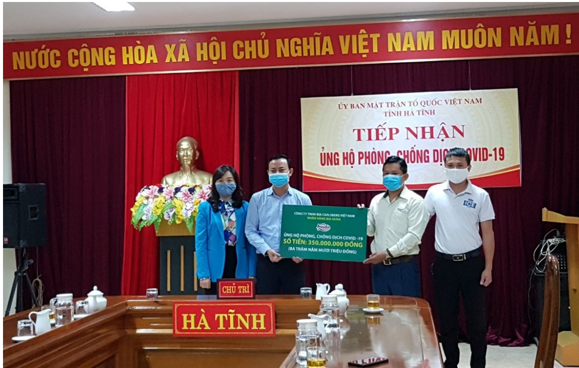
Carlsberg Việt Nam trao tặng tiền ủng hộ phòng, chống COVID-19 cho tỉnh Hà Tĩnh