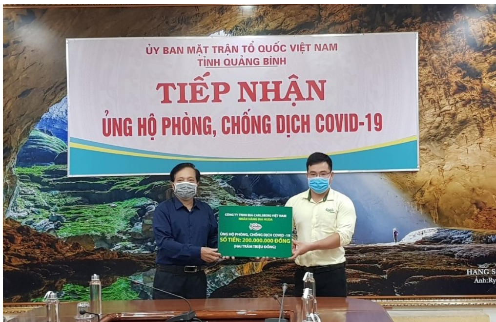
Carlsberg Việt Nam trao tặng tiền ủng hộ phòng, chống COVID-19 cho tỉnh Quảng Bình